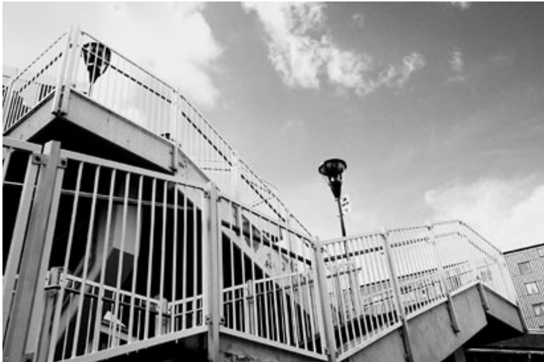
De glasade sidorna på trappträcket visade sig bli kostsamma. Men nu är de utbytta mot ett tåligare vitmålat galler.