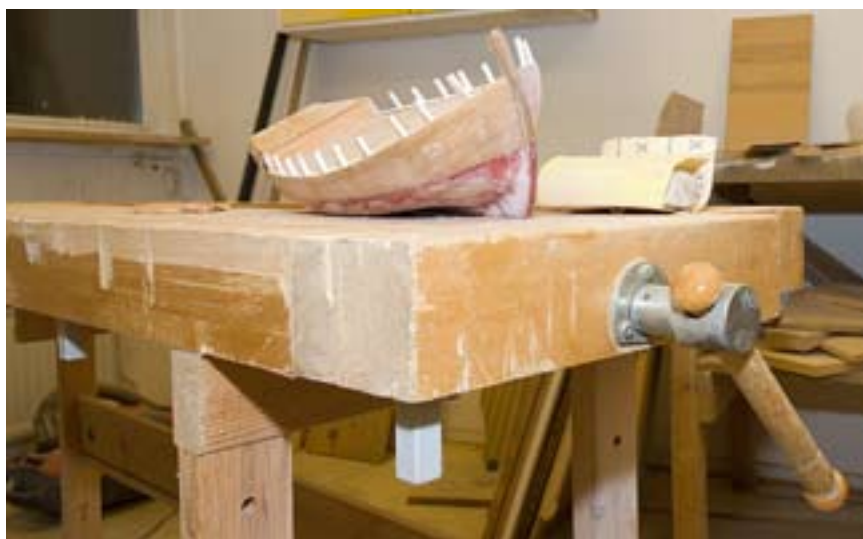
Det blir mycket spån och skräp i snickarverkstan. Kanske har du en dammsugare över?