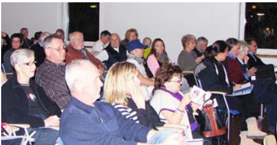
Kanske var det publikrekord i Masthuggets hus när vi fick information om det nya bredbandsnätet.

Sällan eller aldrig har så många kommit till ett möte i Masthuggets hus som den 16 januari 2008 då förvaltningen tillsammans med Teracom och några av de aktuella tjänsteleverantörerna informerade om det nya bredbandet.