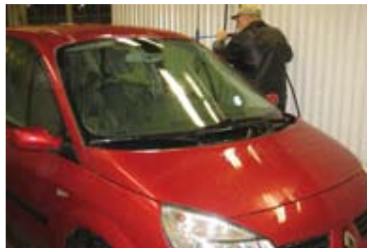
Nu finns det en biltvätt nära oss igen.

Väl inne vid tvättbåsen finns en automat och tavla med instruktioner om hur man går till väga. Följ noga varje steg och glöm inte trycka fyrkant när så är påbudet. När man betalat 40 kronor, antingen med kort eller med mynt, rasslar tvättaggregatet igång och då har man 12 minuter på sig att tvätta bilen. Det gäller att vara väl organiserad och inte spilla bort tiden. Avgifterna skall betala förbruk-