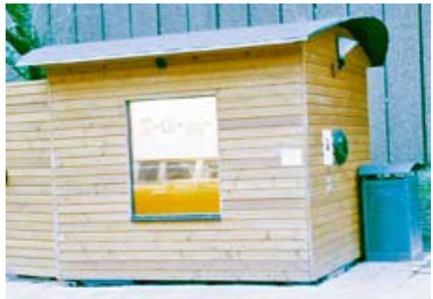
En tiofots container ombyggd till en Somnus-anläggning för 200 hushåll. Ytan är nio kvadratmeter och höjden 2,5 meter.

Om årsstämman stödjer propositionen är det meningen att en anläggning kommer att byggas för att se hur det fungerar. Kjell nämner att den tomma platsen i Masthuggsliden utanför