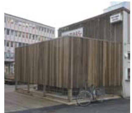
Mot slutet var konstverket dolt bakom ett buskage. Nu är även buskarna borta och här finns nu ett träskjul som döljer en ventilationsanläggning.

Jag träffar åtskilliga som någon gång i sitt liv bott i Nya Masthuggget, som