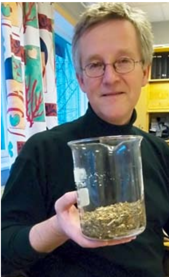
Lätthanterligt och utrymmessnålt avfall blir resultatet av torrkonserveringen.

kräver en del energi. En anläggning för 200 hushåll förbrukar cirka 0,7 kW, vilket innebär en årsförbrukning på cirka 6 500 kWh, vilket är i nivå med två lägenheters årliga hushållsförbrukning. Men enligt Lars Smedlunds beräkningar motsvarar den biogas som kan genereras från avfallet cirka 43 000 kWh.