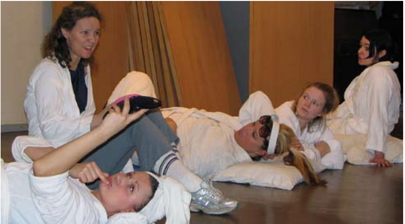
I april blir det premiär för Kvinnofarmen på Masthuggets hus. ScenoDramas amatörer repeterar för fullt.