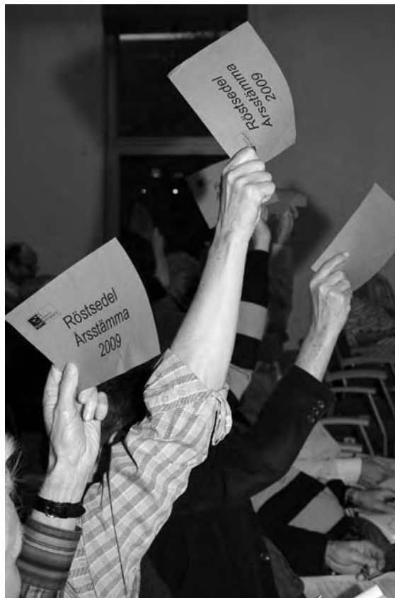
Den som vill ha inflytande får det lättast såhär, genom att rösta på stämman.

sonsliden 8 som liksom föregående motionärer tror på idén med konstgräs. Han vill gå steget längre och belägga grusplanen samt asfaltplanen på Fyrmästaregården med konstgräs och därmed skapa moderna spontanidrottsanläggningar.