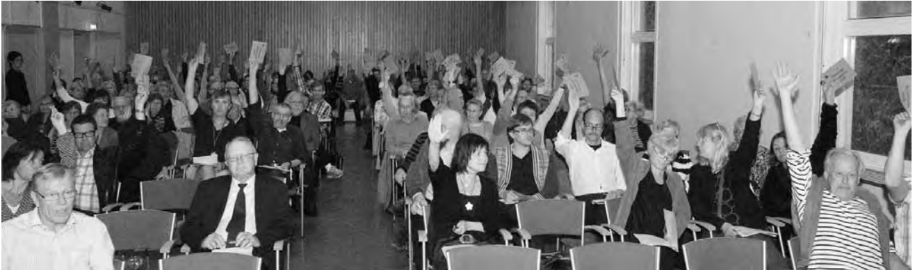
Mycket att rösta om och ovanligt många som ville rösta var det på årets stämma.

Årsstämman hölls torsdagen den 23 april i Masthuggets hus stora sal. Inte helt oväntat infann sig betydligt fler medlemmar denna gång än vad som är brukligt och orsaken var säkert frågan om dygnet-runt-låsta ytterdörrar.