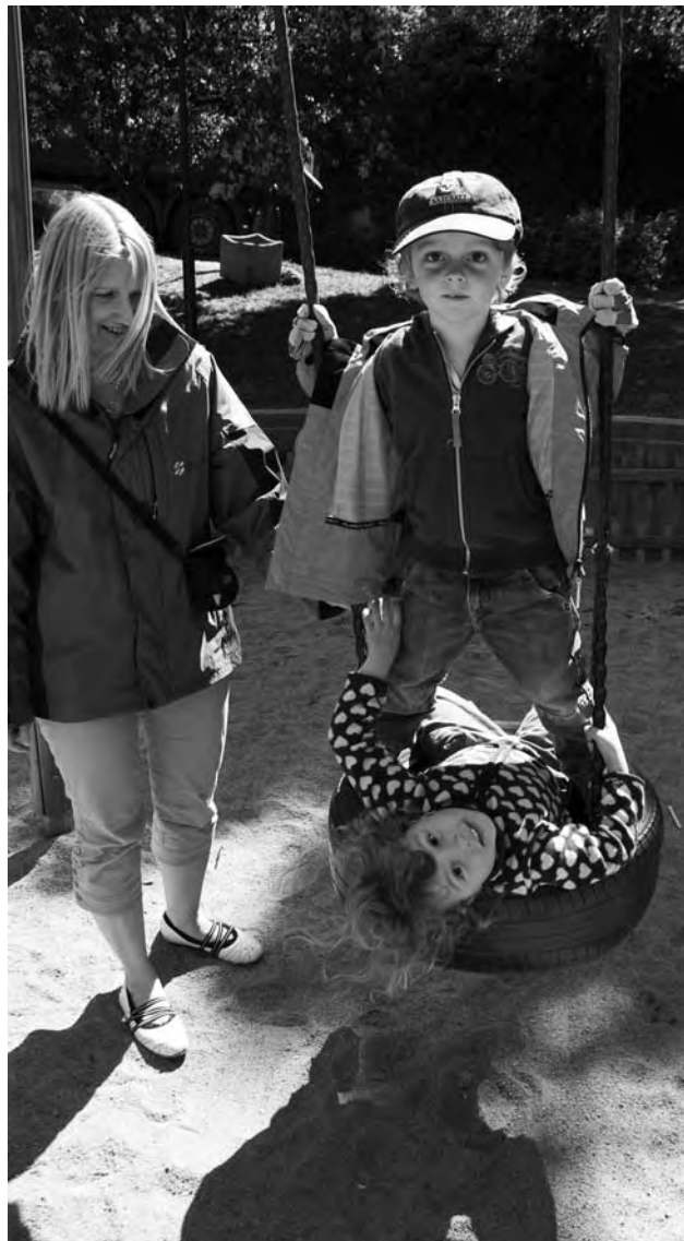
Snygga blå jackor med matchande överdragsbyxor har förskolepersonalen fått.