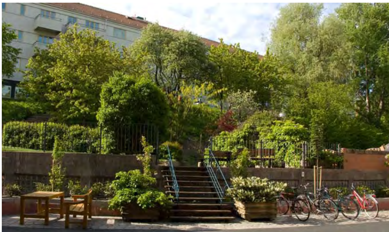
Maj 2009. Alla stora träd och buskar borta och nya har planterats.

ket samtidigt bidrog till att öka insynen i lägenheterna på de nedre planen.