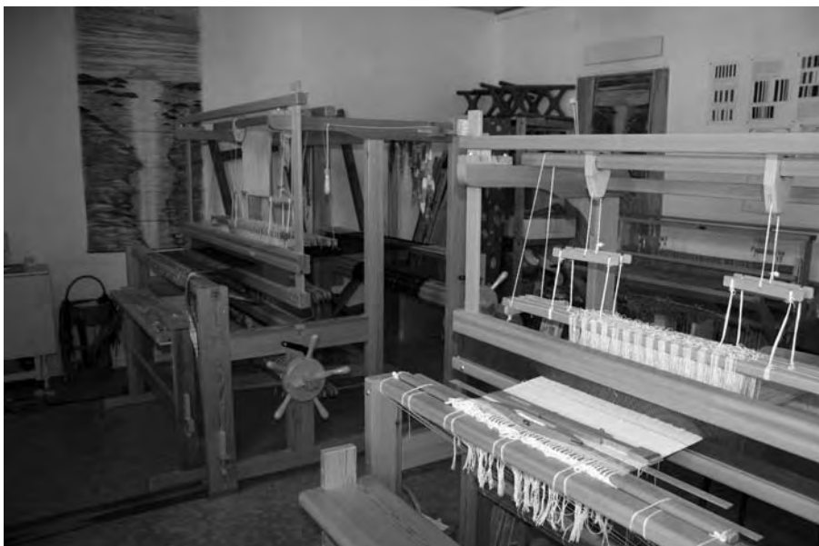
Vävstugan är utrustad med vävstolar som klarar både julduks- och mattvävar.