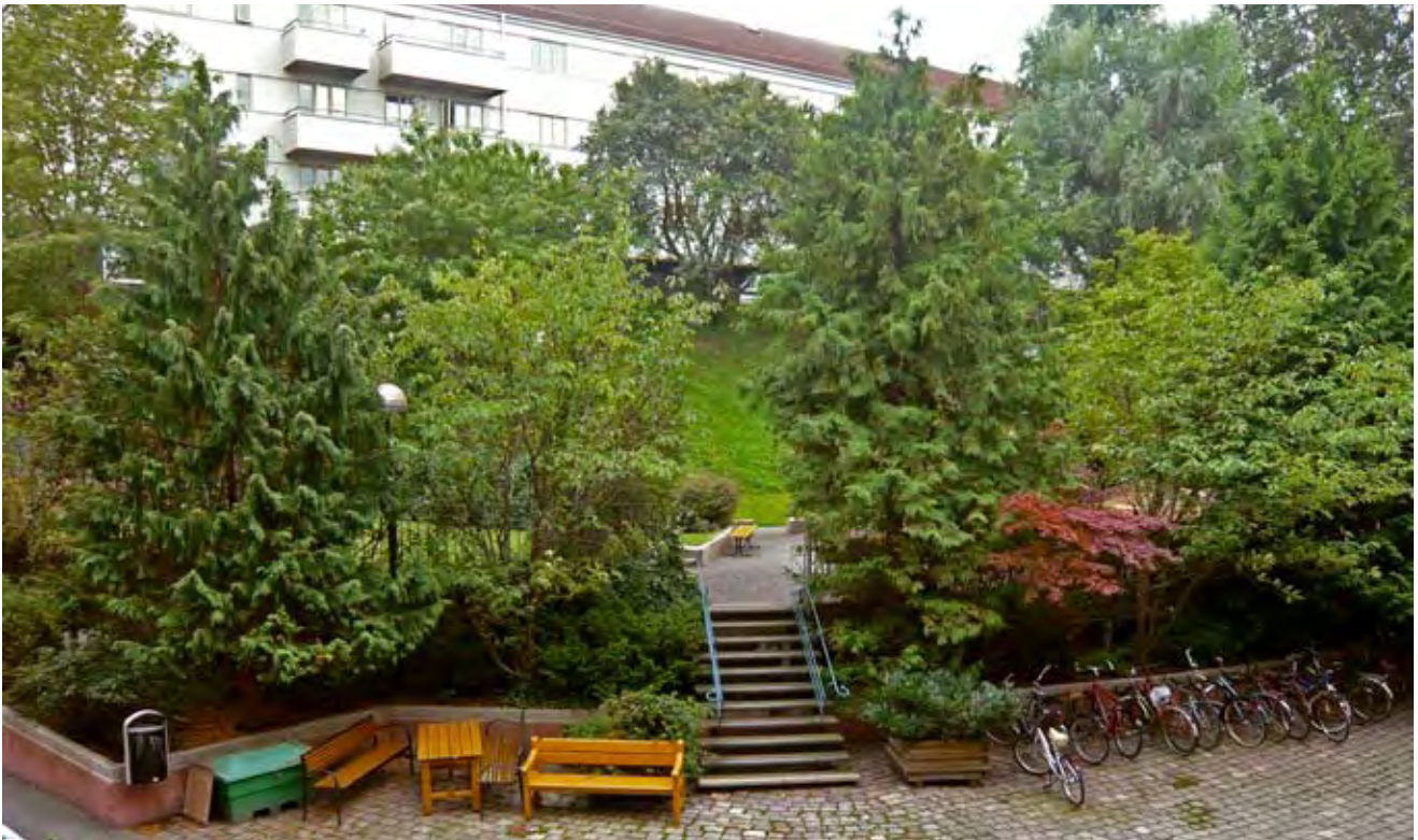
Klamparegatan sommaren 2008, sedd från Lena Israels balkong. Grönt och lummigt.

– Jag tar åt mig av kritiken och tycker nu i efterhand att vi borde ha ordnat ett informationsmöte om de planerade förändringarna.