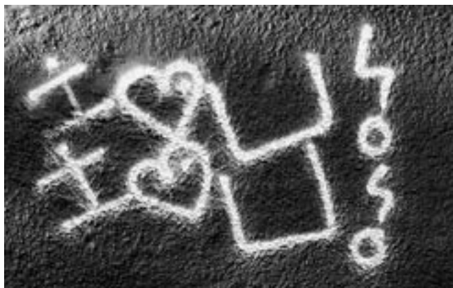
Klotter eller graffiti? Åsikterna är många, men skadegörelsen kostar oss mycket pengar. (Bilden är inte från området)

bomba, som är deras drivkraft? En dyr hobby om man skulle betala själv. En burk sprayfärg kostar 75–100 kronor och räcker till cirka en kvadratmeter.