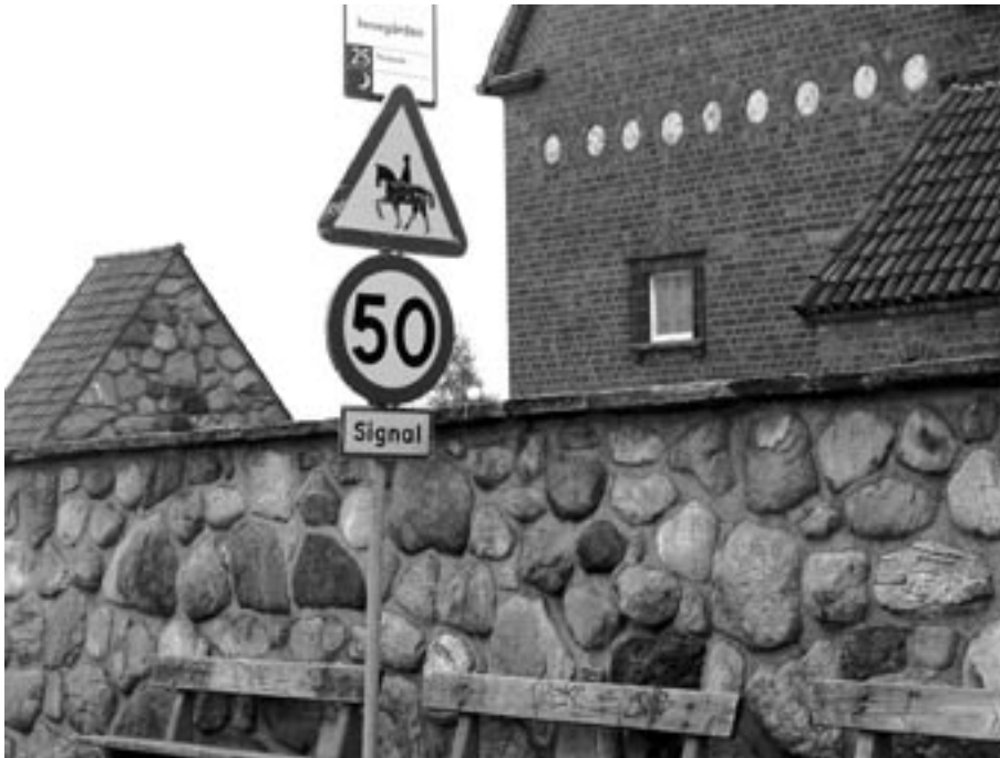
Varning för hästar!? Vid Masthuggskyrkan vore kanske däremot varning för turistbussar på sin plats.

En dag när min morgonpromenad passerade Masthuggskyrkan blev jag mycket förvånad, när några för vårt område ovanliga vägmärken fanns uppsatta på stolpen till Trygga Rundans hållplats. En första tanke var att man kanske provar ny yta på vägmärken i en utsatt miljö med tanke på vädret. Vad jag kan minnas, så har det aldrig gått någon ridväg förbi Masthuggskyrkan och 50-skylden hade heller ingen logisk förklaring. Kanske skulle det vara 30. Och så varning för signal. Är det gatuarbete på gång, funderade jag på. Tankarna gick kors och tvärs, tills jag kom på att det förmodligen var ett 0-upptåg från någon Väg- och vattenstuderande på Chalmers.